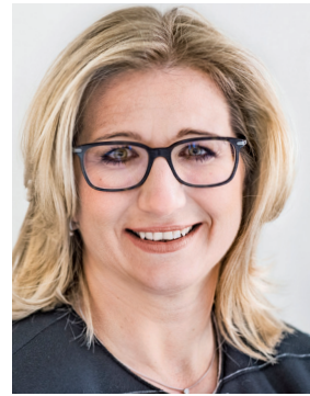
Anke Rehlinger Stellv. Vorsitzende